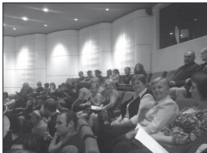
Koncert v kongresovém centru