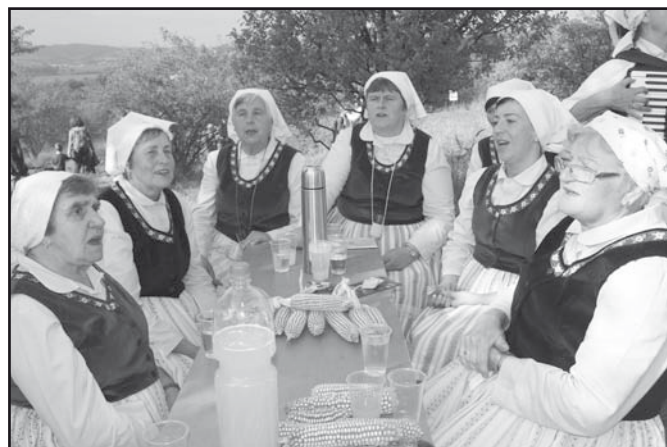
Rochus v Mařaticích